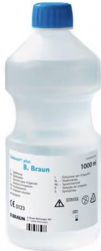
Q vann saltmedikal