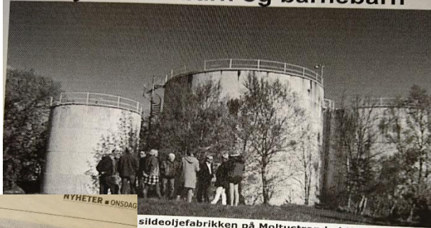
NYHETER # ONSDAG sildeoljefabrikken på Moltustranda i Herøy er reddet dersom det blir lagra avfall der. Selskapet kjemper om å få mellomlagre avfall fra tanker. OLAUFG BJØRNESET er rundt 60 år gamle og ligg 32 meter frå næraste bustad. OLAUFG BJØRNESET er oppvatn og boreslam i sildeoljefabrikken. Sildeoljefabrikken er oppvatn og boreslam i sildeoljefabrikken. Å gassen som vil sive ut. Det er lukt, men han er der. Med barn og barnebarn?