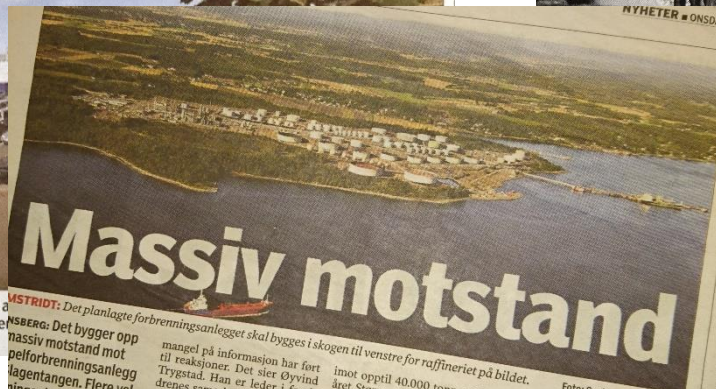
MSTRID: Det planlagte forbrenningsanlegget skal bygges i skogen til venstre for raffineriet på bildet. MSBERG: Det bygges opp massiv motstand mot pelforbrenningsanlegg i lagentangen. Flere vel...