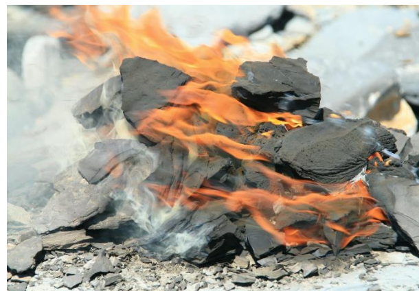
Syredannende bergarter kan selvantenne