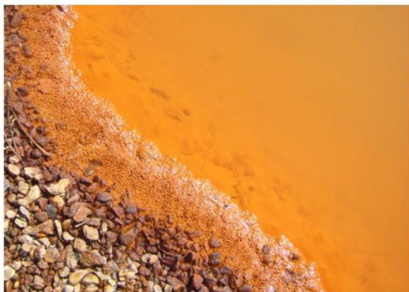
Utlekking fra syredannende bergarter