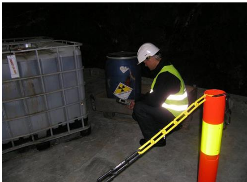
Statens strålevern på tilsyn