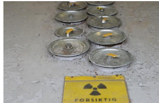
Lagret brukt brensel i JEEP I stavbrønn