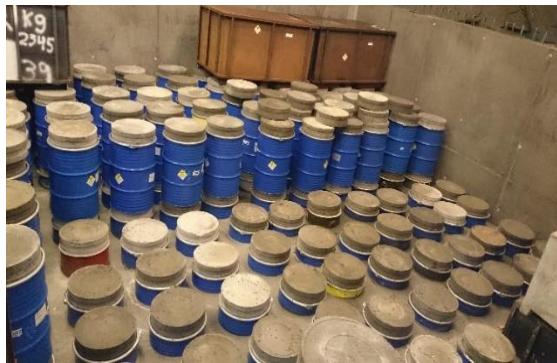
Deponert radioaktivt avfall i KLDRH Himdalen