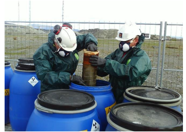
Radioaktivt avfall fra petroleumsindustrien