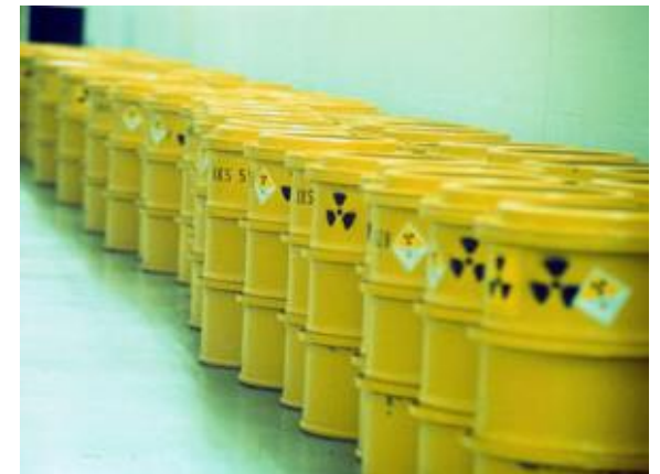
Nukleært radioaktivt avfall