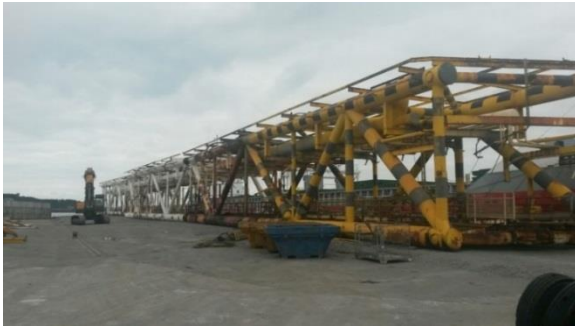
Ekofisk 2/4 G bridge