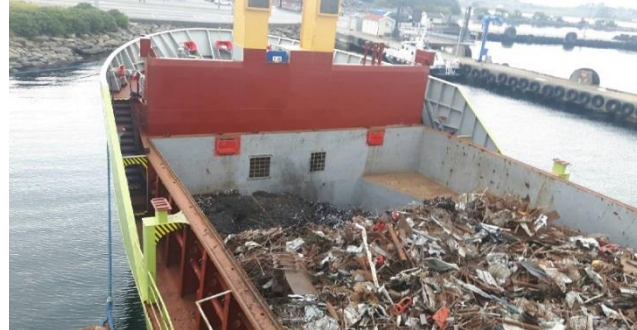
Resirkulerte råvarer på vei til nye produkter