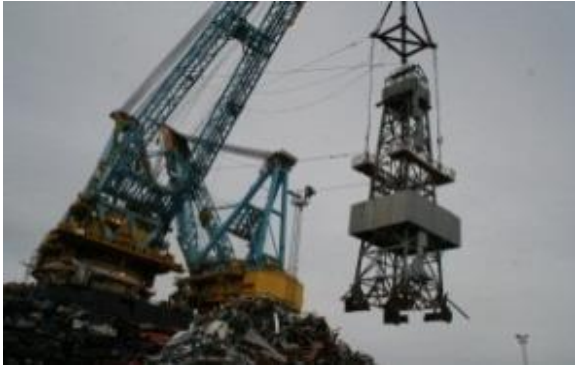
Heimdal drill tower and derrick