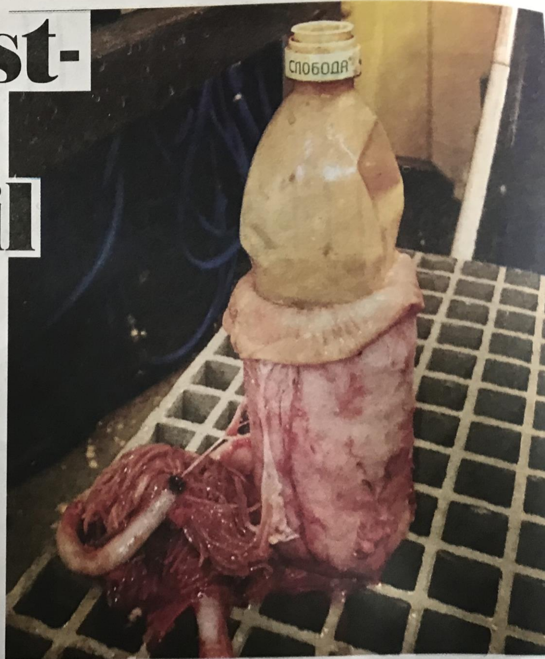
PLASTIKK: Fisken hadde fått i seg denne flasken. Den har russisk-lignende skrift: «Sloboda».

De siste årene har debatten rast om plastavfall i havet. Blant annet er det påvist plastikk i fire av fem blåskjell som er testet.